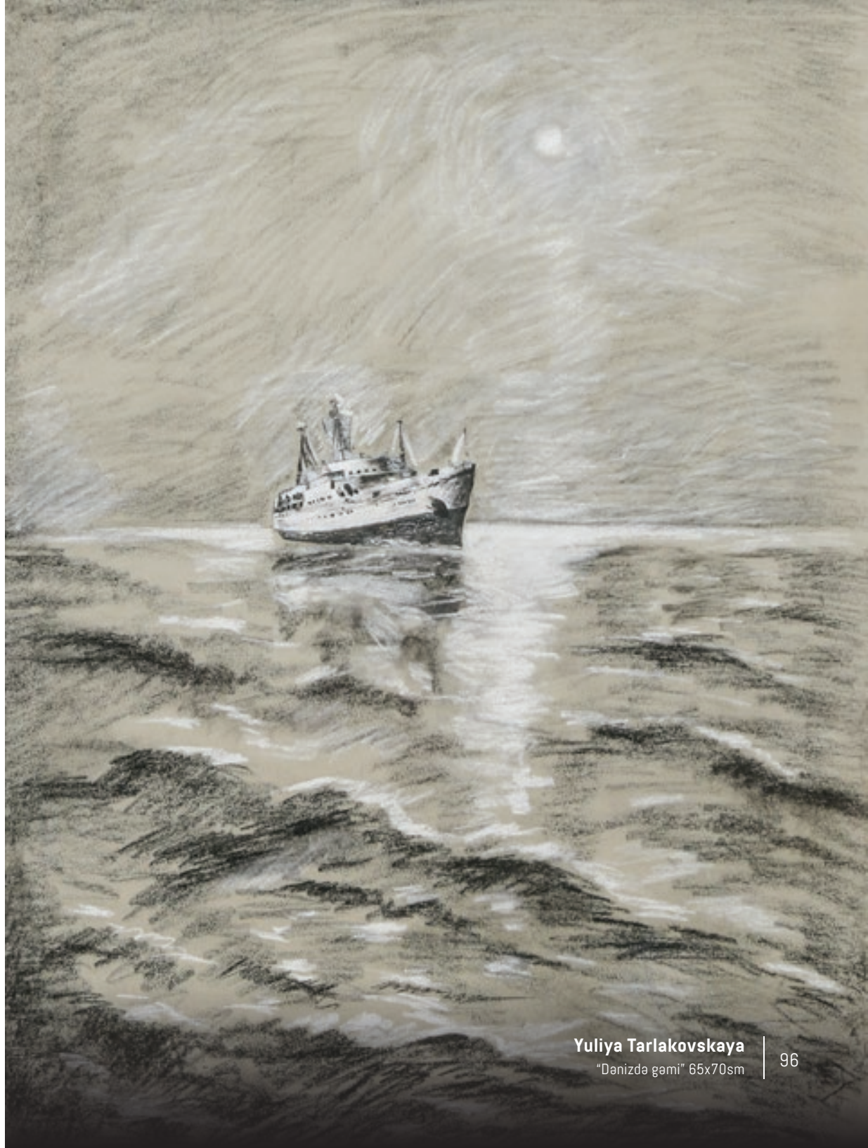
Yuliya Tarlakovskaya "Danizda gemi" 65x70sm