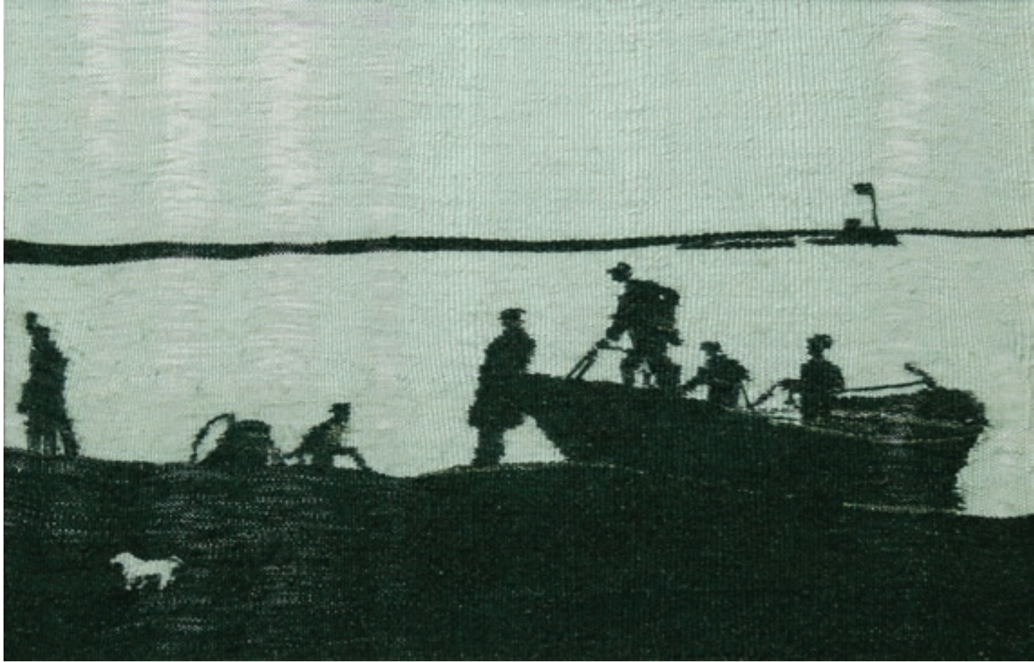
Jalə Əliyeva "Gemiçi" 60x40sm Qobelen