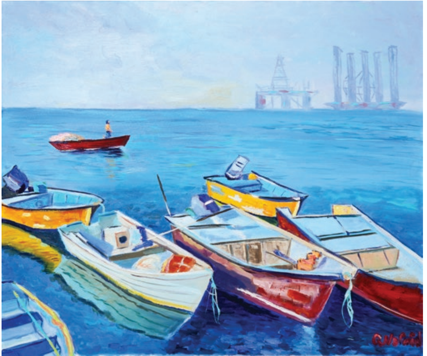
Nərmin Quliyeva "Gemilar" 74x65sm