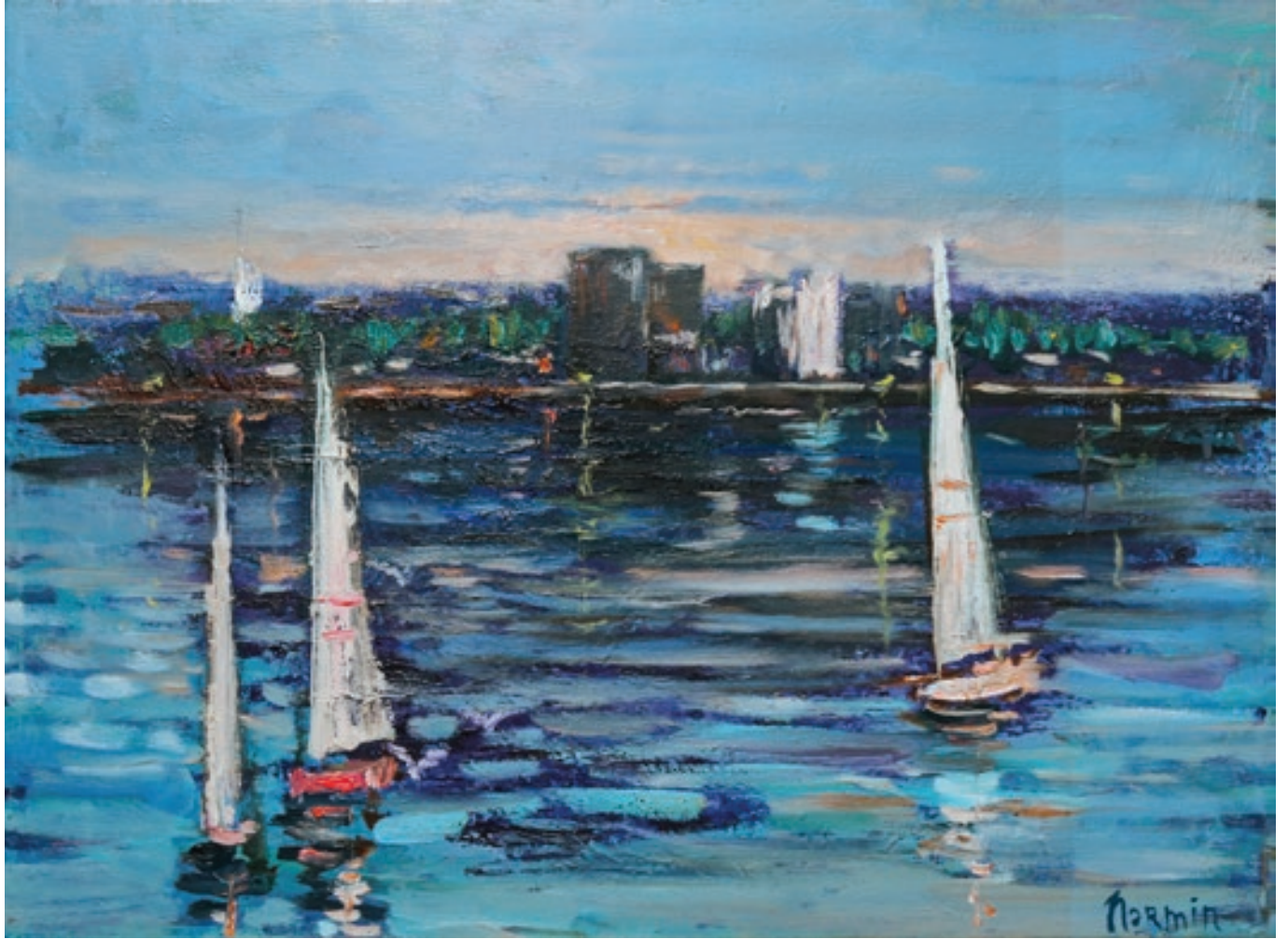
Nərmin Paşazadə "Bakı buxtası" 70x50sm