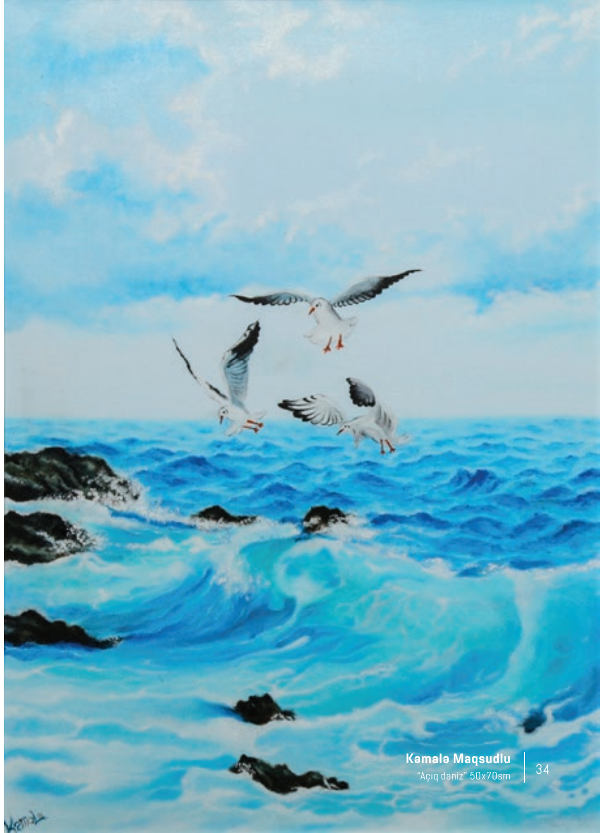
Kemala Maqsudlu "Açıq dəniz" 50x70sm