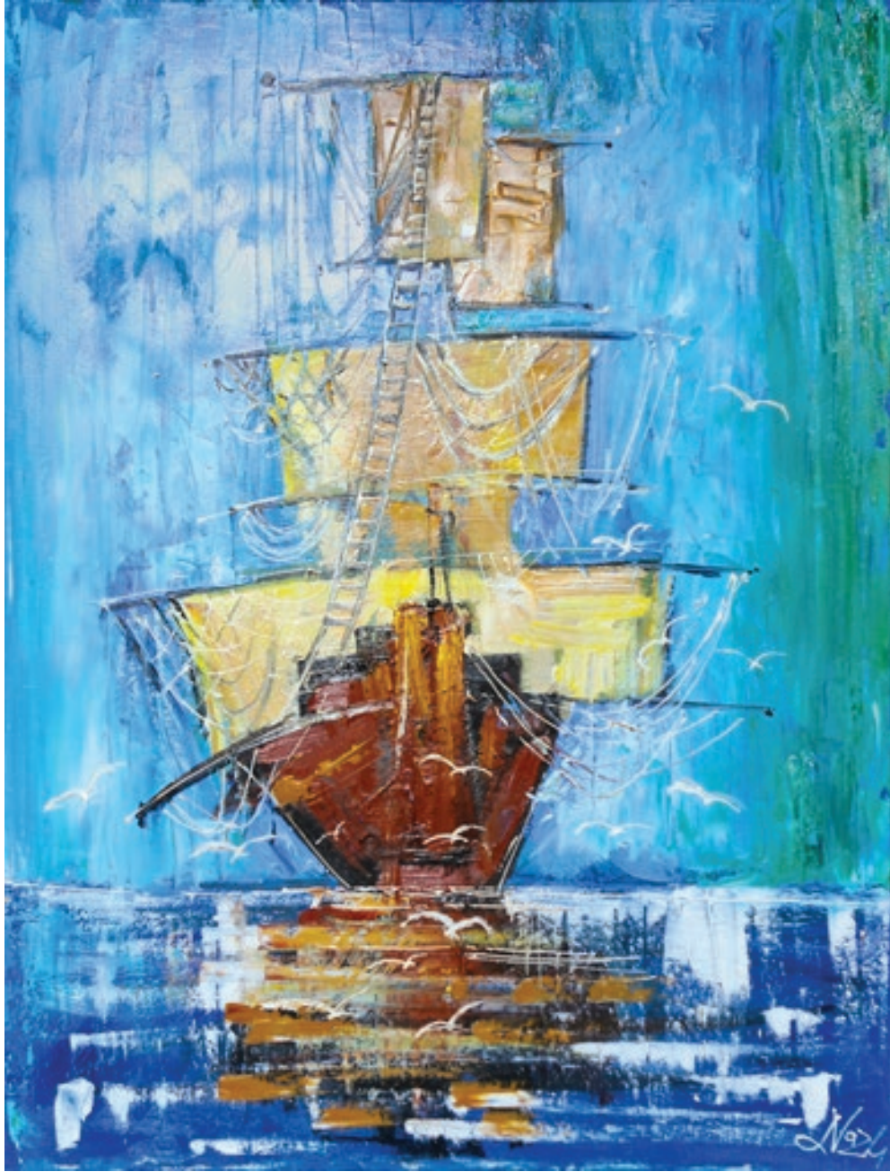
Ələkbər Yusublu "Mənim düşüncəm" 60x60sm