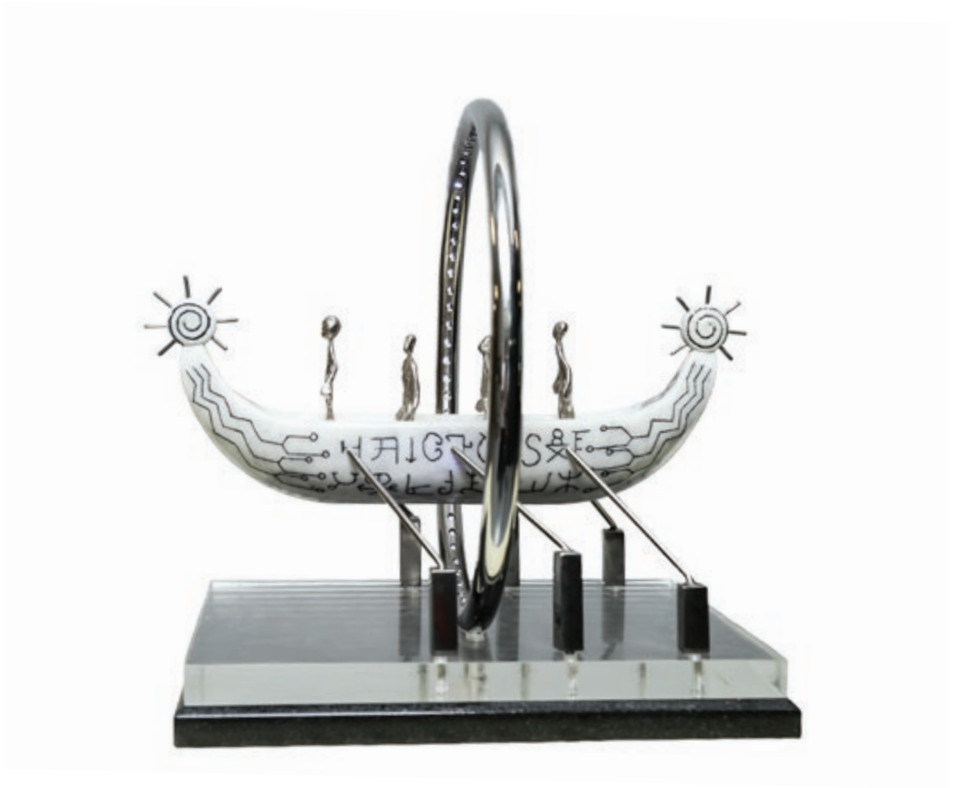
Süleyman Rüstəmov "Oyanış" 33x42x39sm