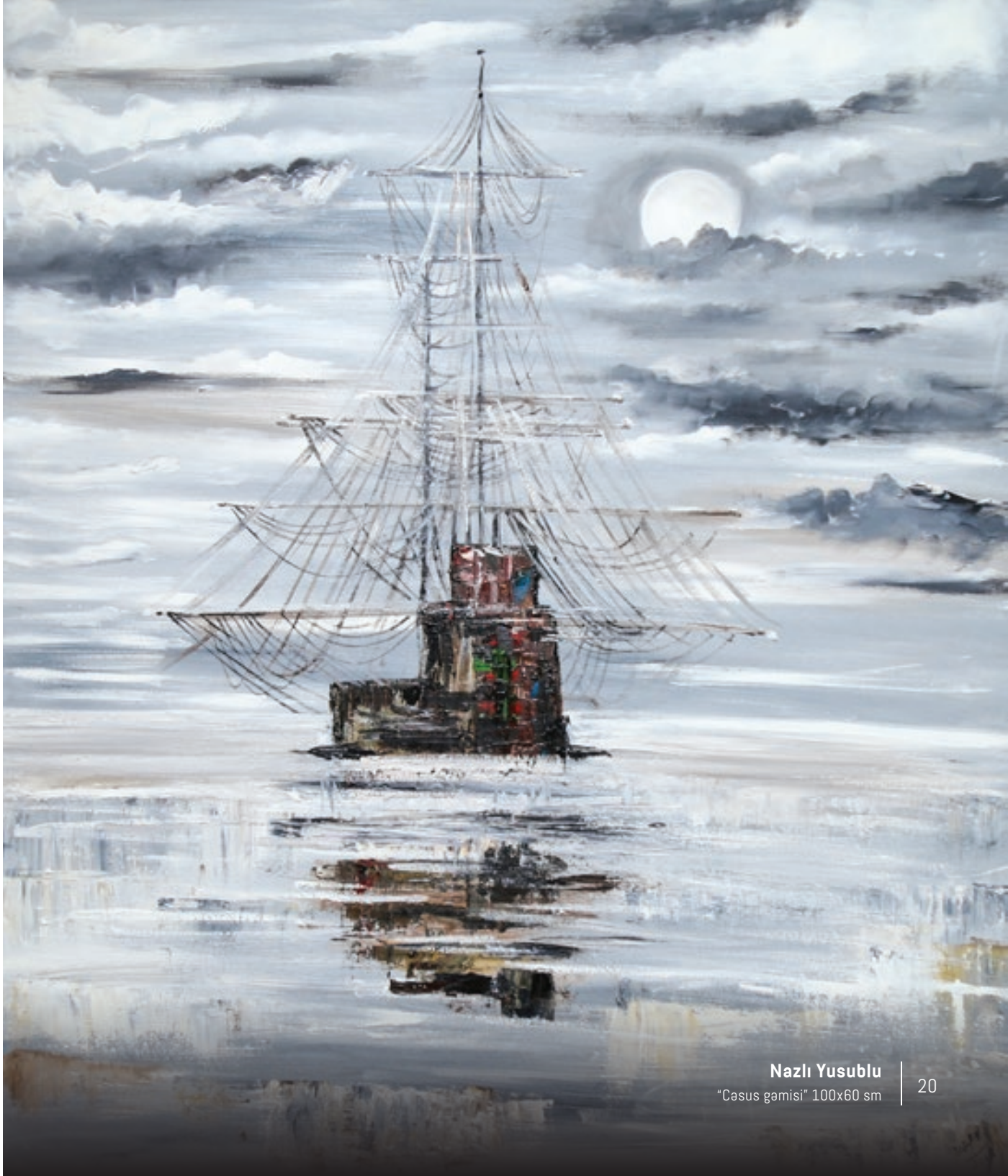
Nazlı Yusublu "Çasus gemisi" 100x60 sm