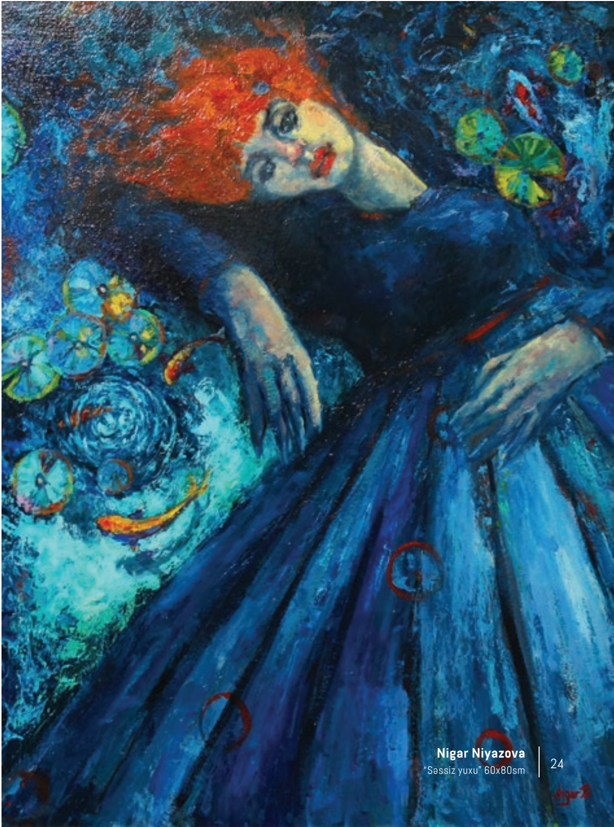
Nigar Niyazova "Sassiz yuxu" 60x80sm