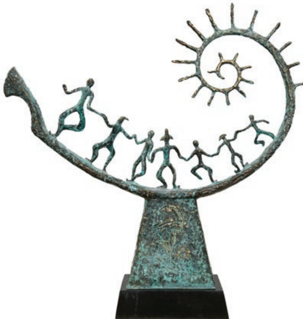
İmran Kərimov "Tarixin izi" 60x60x10sm