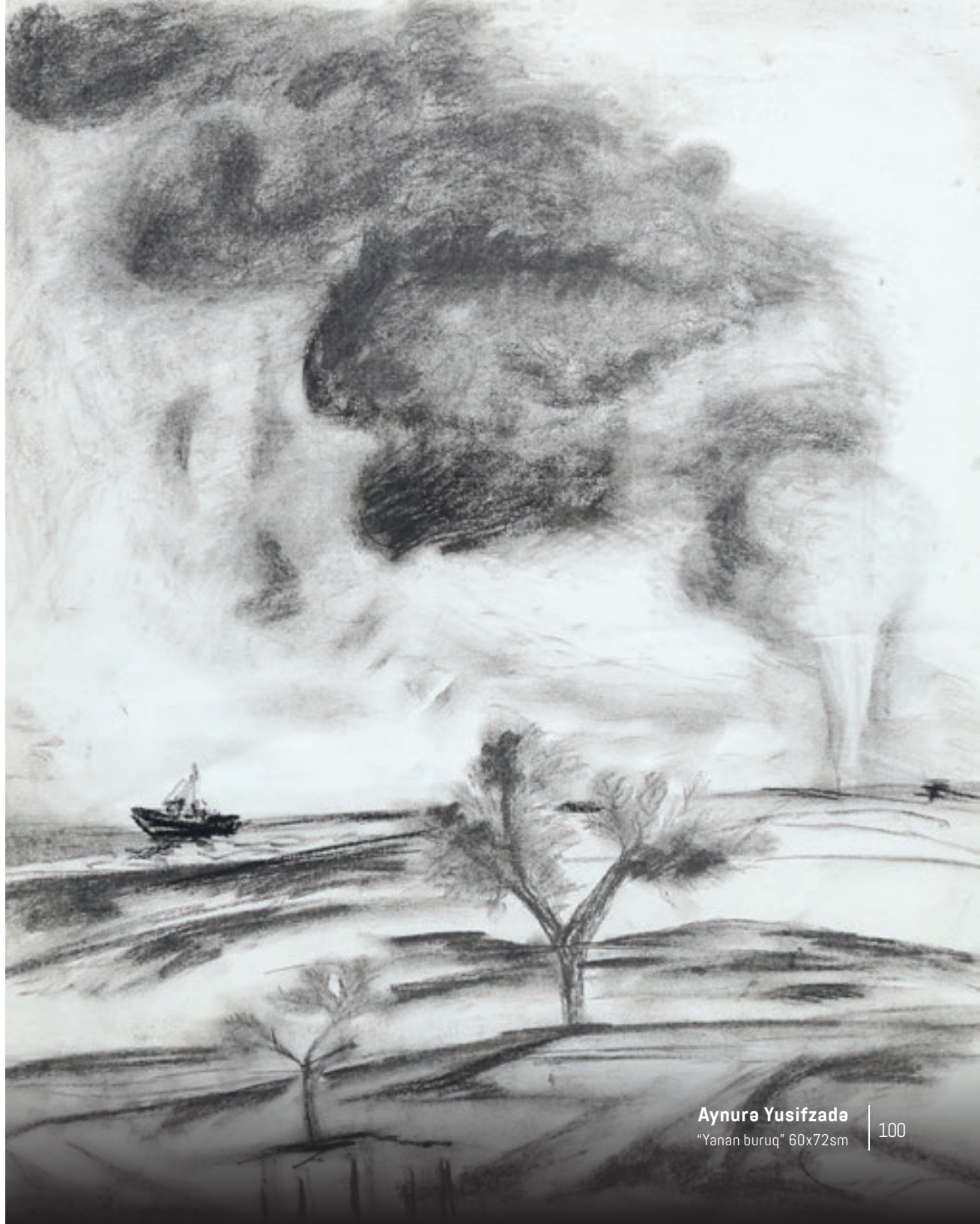
Aynurə Yusifzadə "Yanan buruq" 60x72sm