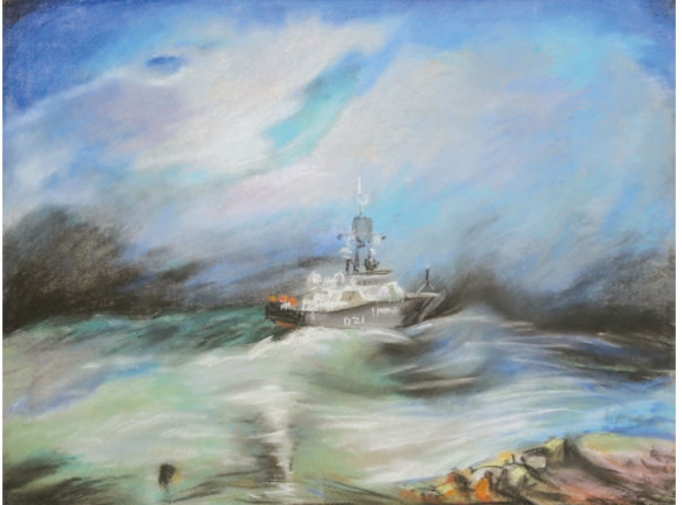
Yuliya Tarlakovskaya "Deniz" 120x100sm