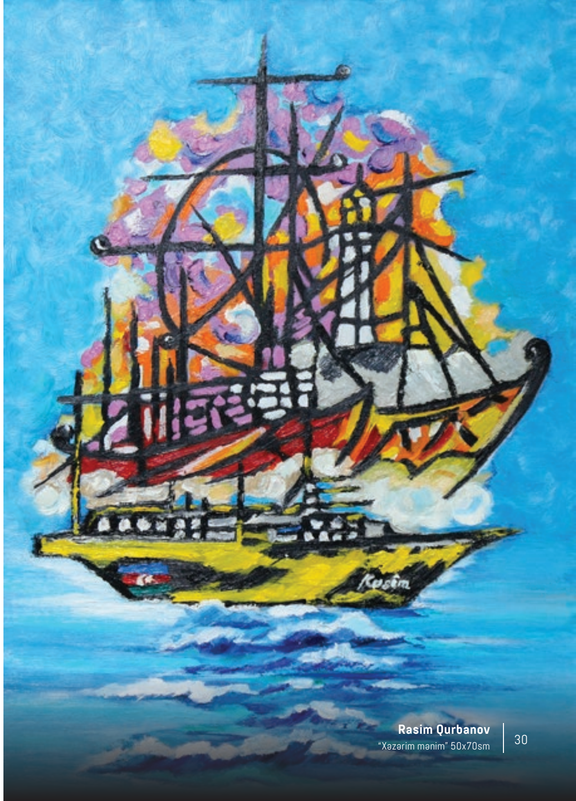
Rasim Qurbanov "Xəzərim mənim" 50x70sm