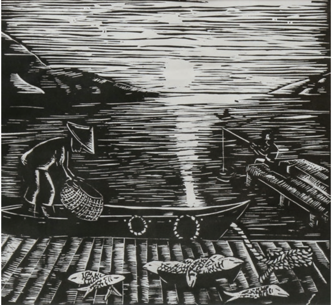
Günay Mustafazadə "Balıqçı qayığı" 35x35sm