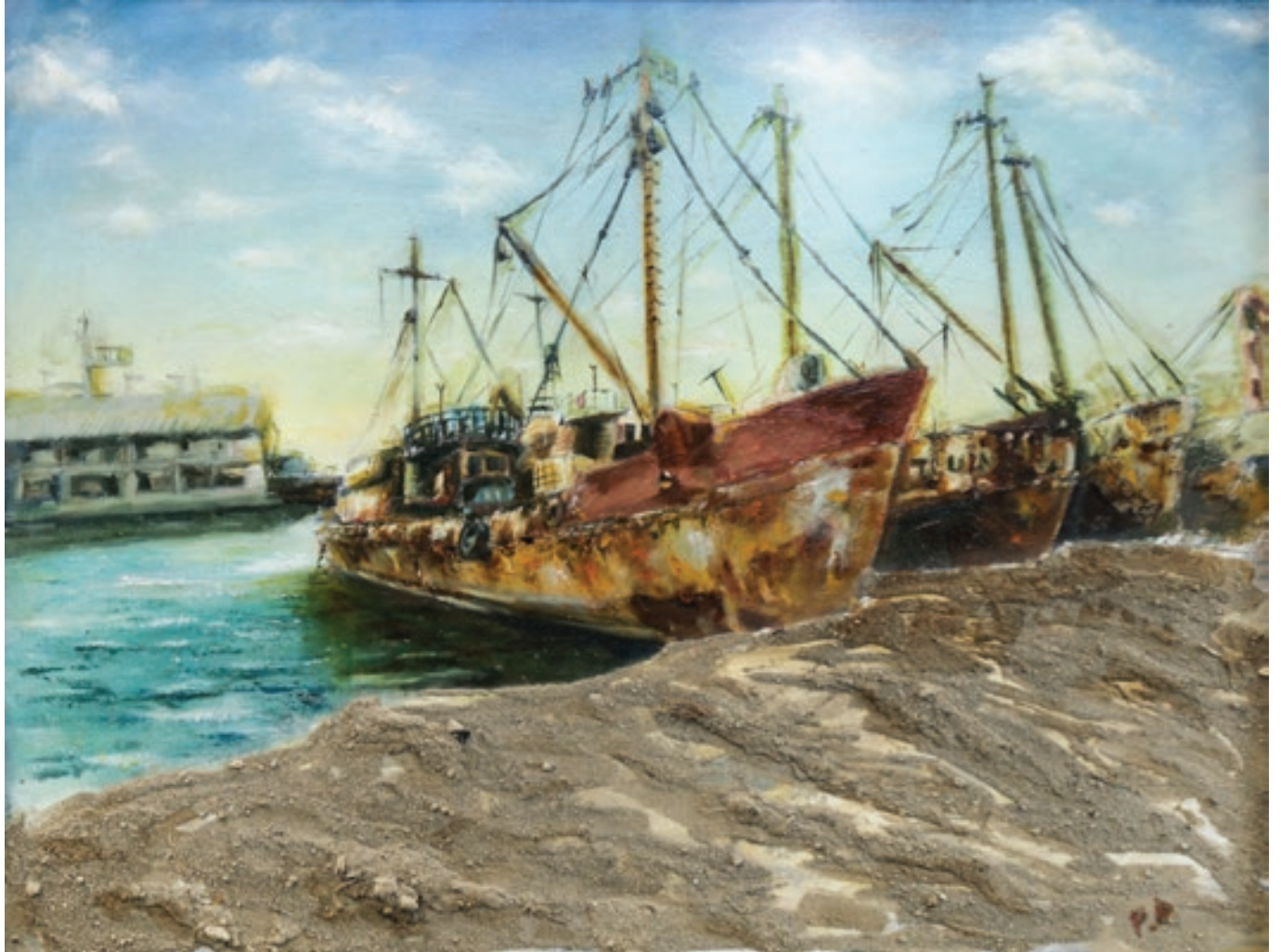
Pervane Əhmədova | "Xəzərin sahilində" 90x70sm