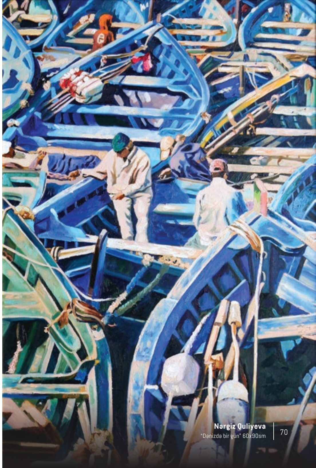
Nərgiz Quliyeva "Denizdə bir gün" 60x90sm