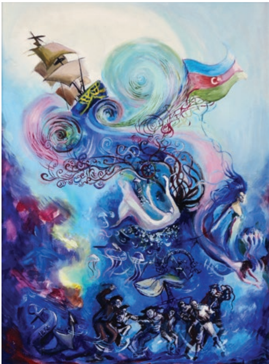
Sevinc Quliyeva "Dalğalara hökmranlıq" 50x70sm