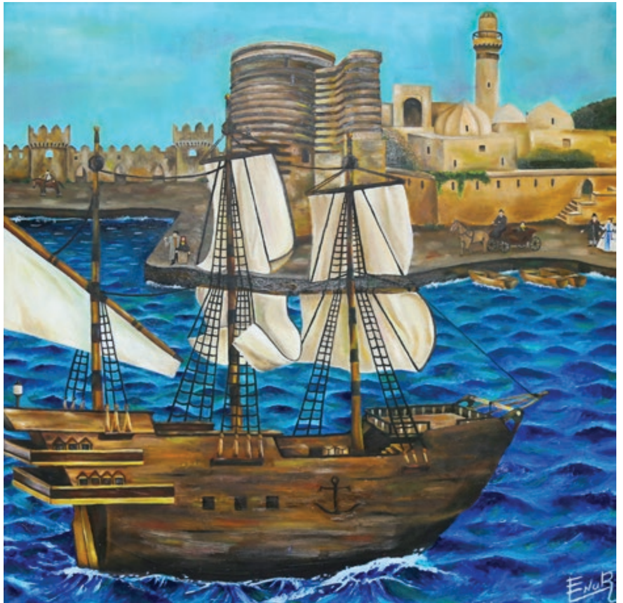
Elnur Camalov "Bakı və dəniz" 100x100sm