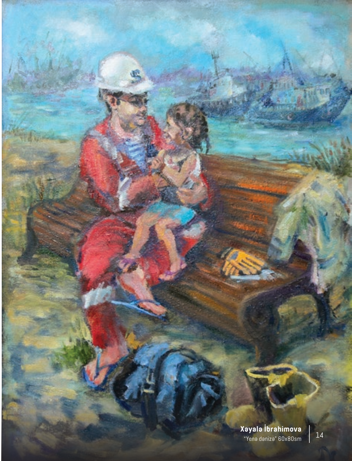
Xeyalə İbrahimova "Yene dənizə" 60x80sm