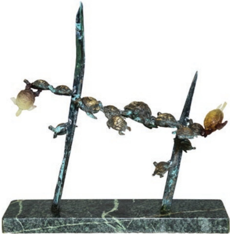
Sahib Yaqubov "Denizçiler" 38x20x38sm