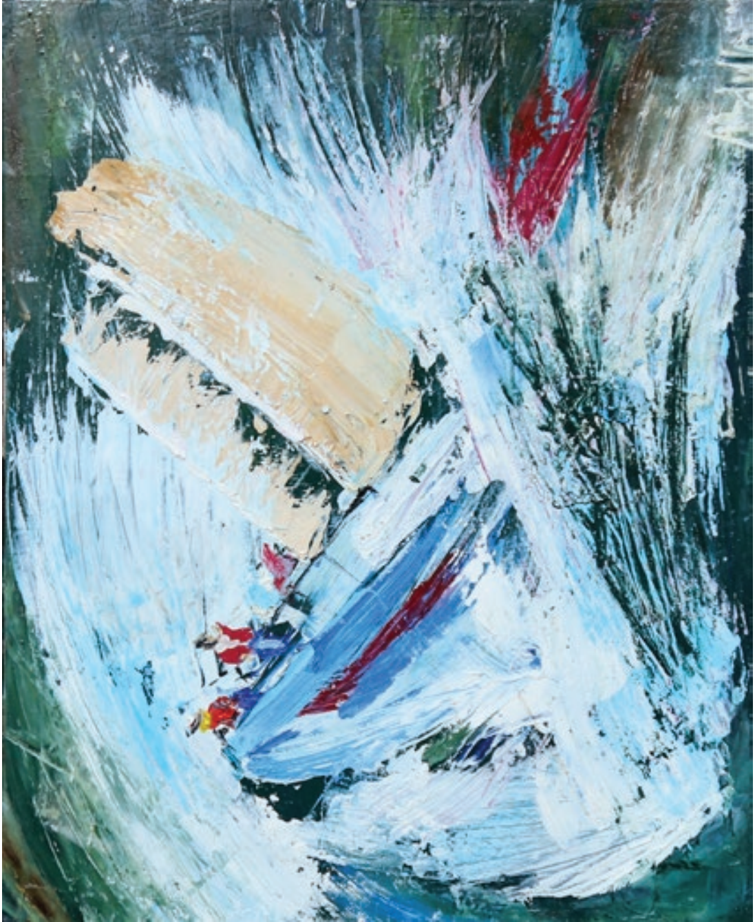
Murad Abdullayev "Dalğalar içində" 56x46sm