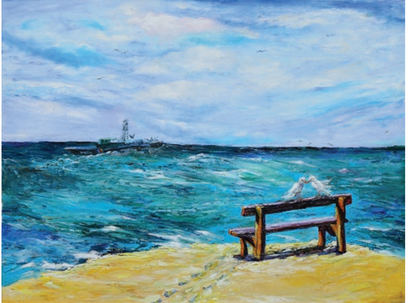
Emiliya Ibrahimova "Xazerim" 90x70sm