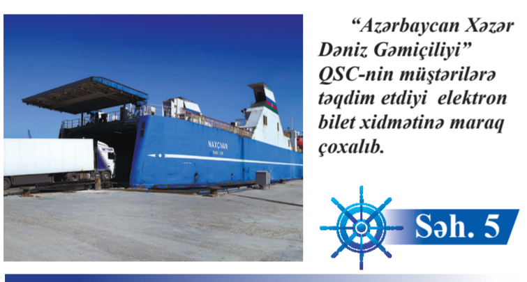
"Azərbaycan Xəzər Dəniz Gəmiçiliyi" QSC-nin müştərilərə təqdim etdiyi elektron bilet xidmətinə maraq çoxalıb.