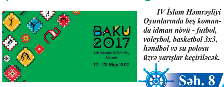
IV İslam Həmrəyliyi Oyunlarında beş komanda idman növü - futbol, voleybol, basketbol 3x3, həndbol və su polosu üzrə yarışlar keçiriləcək.