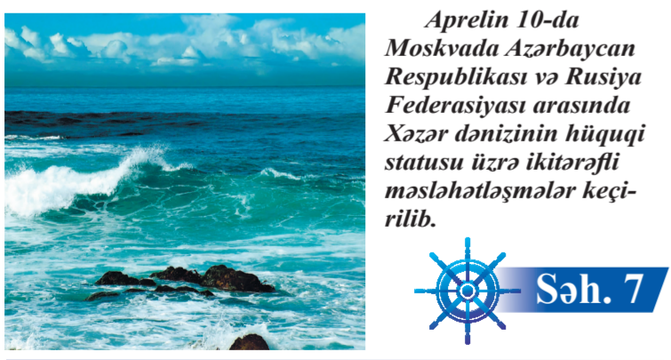
Aprəlin 10-da Moskvada Azərbaycan Respublikası və Rusiya Federasiyası arasında Xəzər dənizinin hüquqi statusu üzrə ikitərəfli məsləhətləşmələr keçirilib.