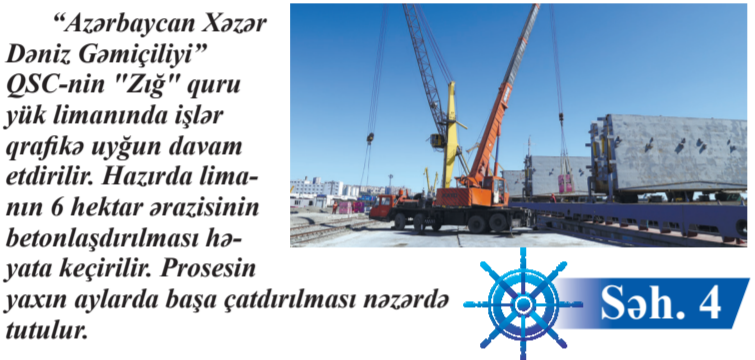
"Azərbaycan Xəzər Dəniz Gəmiçiliyi" QSC-nin "Zığ" quru yük limanında işlər qrafika uyğun davam etdirilir. Hazırda limanın 6 hektar ərazisinin betonlaşdırılması həyata keçirilir. Prosesin yaxın aylarda başa çatdırılması nəzərdə tutulur.