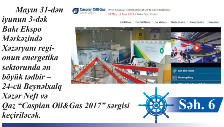
Mayın 31-dən iyunun 3-dək Bakı Ekspo Mərkəzində Xəzəryanı regionun energetika sektorunda ən böyük tədbir – 24-cü Beynəlxalq Xəzər Neft və Qaz "Caspian Oil & Gas 2017" sərgisi keçiriləcək.