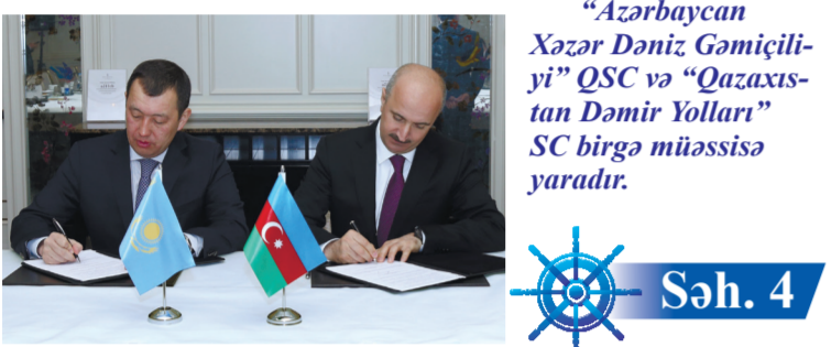
"Azərbaycan Xəzər Dəniz Gəmiçiliyi" QSC və "Qazaxıstan Dəmir Yolları" SC birgə müəssisə yaradır.

AZƏRBAYCAN VƏ QAZAXISTAN TRANSXƏZƏR DƏHLİZİ ÜZRƏ YÜKDAŞIMALAR SAHƏSİNDƏ ƏMƏKDAŞLIĞI DAHA DA GENİŞLƏNDİRİR